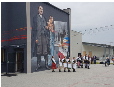
Odsłonięcie muralu w Wierzchosławicach - 25 września 2019

25 września 2019 r. na fasadzie Specjalnego Ośrodka Szkolno-Wychowawczego w Dwudniakach (Wierzchosławice) odsłonięto mural autorstwa Ryszarda Paprockiego, przedstawiający jednego z Ojców Niepodległości – Wincentego Witosa. Dzieło było współfinansowane przez IPN.