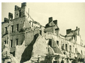
Ruiny zniszczonych budyńków na rogu ul. Marszałkowskiej !