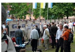
Prezentacja wystawy o pielgrzymkach stanowych do Piekar Śląskich w 2010 r.