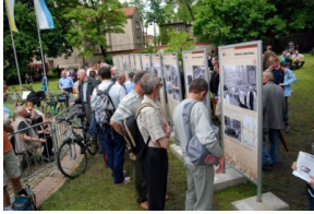
Prezentacja wystawy o pielgrzymkach stańowych do Piekar Śląskich w 2010 r.