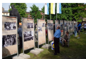
Prezentacja wystawy o pielgrzymkach stanowych do Piekar Śląskich w 2010 r.