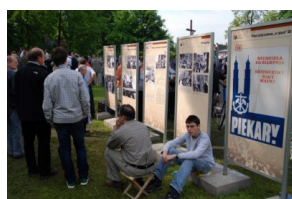
Prezentacja wystawy o pielgrzymkach stanowych do Piekar Śląskich w 2010 r.

Celem prezentowanej wystawy jest przybliżenie odbiorcom działań aparatu bezpieczeństwa wobec piekarskich pielgrzymów w Polsce Ludowej, z akcentem na lata 60. i 70. minionego wieku. Ekspozycja ukazuje na podstawie zachowanych materiałów Służby Bezpieczeństwa metody i techniki inwigilacji pielgrzymów przybywających do Piekar Śląskich. Przedstawia stanowe zjazdy wyłącznie z perspektywy Służby Bezpieczeństwa. Na wystawę składa się 26 plasz, w których wykorzystano materiały archiwalne ze zbiorów: Archiwum Parafialnego w Piekarach Śląskich, Archiwum Instytutu Pamięci Narodowej w Katowicach oraz Archiwum Instytutu Pamięci Narodowej w Warszawie. Scenariusz wystawy przygotowali historycy katowickiego oddziału IPN: dr Łucja Marek oraz Robert Ciupa, przy współpracy Moniki Bortlik-Dźwierzynskiej oraz Eweliny Małachowskiej, a także merytorycznym wsparciu dr. hab. Adama Dziuroka.