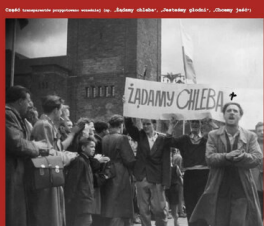
Průchod Prahou po 16. listopadu 1945