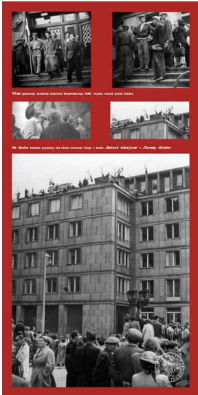
Veliká shromáždění lidstva v Praze, 1945