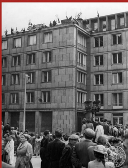
Na oblohu budovy přichází na balkonovou stávkou a lidé „dávají věstírky“ („obrovský oběd“)