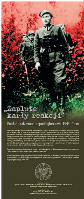
„Zaplute karty reakcji” - polskie podziemie niepodległościowe 1944-1956