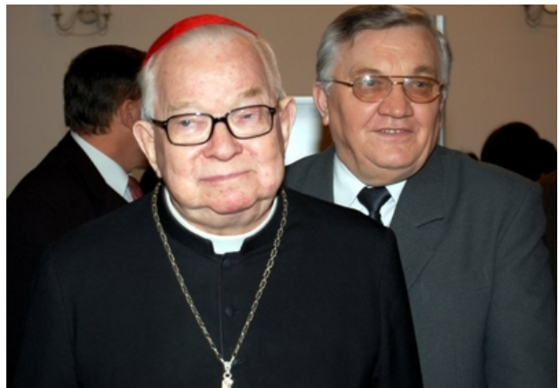
Ksiądz kardynał Henryk Gulbinowicz