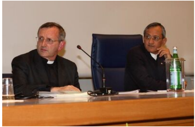
Z prawej strony ks. Pascual Chávez Villanueva, przełożony generalny Salezjanów