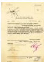
Postanowienie z 26 listopada 1955 r. o założeniu sprawy ewidencyjno-obszerniczej na ks. Władysława Findysza IPN-Rz-052/400, k. 1