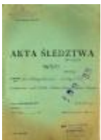
Okładka teczki - akta śledztwa przeciwko ks. Władysławowi Findyszowi IPN-Rz-34/39