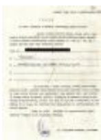
Odezwa ks. Władysława Findysza skierowana do parafian IPN-Rz-34/39, k. 146