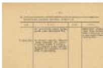
Kwestionariusz personalny ks. Władysława Findysza /fragment/ opracowany przez Referat ds. Bezpieczeństwa KPMO w Jaśle IPN-Rz-052/400, k. 2, 8