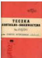
Okładka teczki kontrolno-obszerniczej przeciwko ks. Władysławowi Findyszowi IPN-Rz-052/400