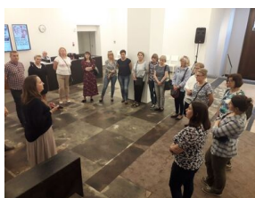
Nauczyciele w Żydowskim Instytucie Historycznym w ramach kursu „Śladami wojennych dramatów - edukacja w miejscach pamięci” - 26 kwietnia 2019