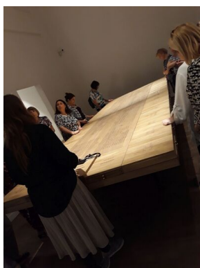
Nauczyciele w Żydowskim Instytucie Historycznym w ramach kursu „Śladami wojennych dramatów - edukacja w miejscach pamięci” - 26 kwietnia 2019