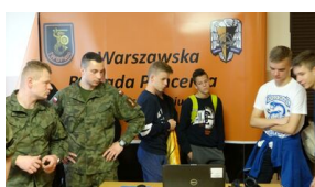
Wielki finał Ogólnopolskiego Turnieju „Misia Wojtka” - dzień trzeci, 22 maja 2019