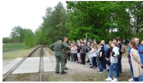
Wielki finał Ogólnopolskiego Turnieju „Misja Wojtka” - dzień drugi, 21 maja 2019