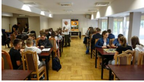
Wielki finał Ogólnopolskiego Turnieju „Misja Wojtka” - dzień drugi, 21 maja 2019