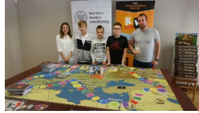
Wielki finał Ogólnopolskiego Turnieju „Misja Wojtka” - dzień drugi, 21 maja 2019