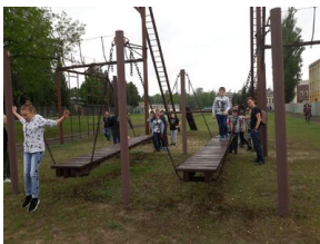
Wielki finał Ogólnopolskiego Turnieju „Misja Wojtka” - dzień drugi, 21 maja 2019