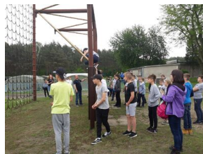
Wielki finał Ogólnopolskiego Turnieju „Misja Wojtka” - dzień drugi, 21 maja 2019