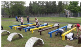
Wielki finał Ogólnopolskiego Turnieju „Misja Wojtka” - dzień drugi, 21 maja 2019