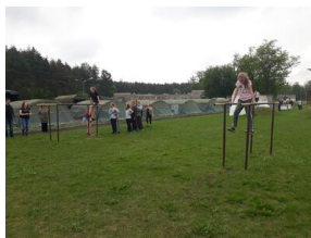
Wielki finał Ogólnopolskiego Turnieju „Misja Wojtka” - dzień drugi, 21 maja 2019

Cóż to był za dzień. Pogoda dopisała i udało się zwiedzić bazę 1 Brygady Pancernej. Niestety uczestnicy turnieju mogli zobaczyć tylko namiastkę wyposażenia najlepszej brygady w Polsce, ale i tak było warto. Każdy mógł wejść to najlepszego czołgu, jakim dysponuje polska armia, czyli Leoparda 2, i samemu przekonać się, czy jest w nim odpowiednio dużo miejsca dla 4 członków załogi. Dzięki żołnierzom służącym w jednostce udało się zaobserwować, jak taki czołg się porusza i jak się go tankuje. Zgadnijcie, ile Leopard spala paliwa i czy samemu byłoby was stać na jego utrzymanie? Otóż na 100 km w warunkach bojowych potrafi spalić nawet 800 litrów paliwa. Kolejnym punktem była strzelnica, na której odbywały się szkolenia z zakresu rzucania granatem. Żołnierz po odbezpieczeniu granatu ma ok 2 sekund, aby go rzucić. To nie takie proste, jak się wydaje – po prostu rzucić granatem, o czym przekonali się uczestnicy