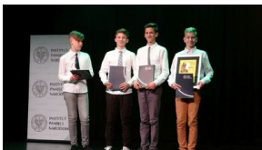
Wielki finał Ogólnopolskiego Turnieju „Misja Wojtka” - dzień drugi, 21 maja 2019