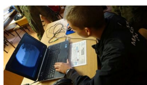
Wielki finał Ogólnopolskiego Turnieju „Misia Wojtka” - dzień trzeci, 22 maja 2019

Jeszcze raz gratulujemy zwycięzcom turnieju.