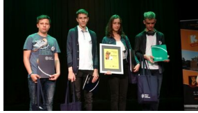
Wielki finał Ogólnopolskiego Turnieju „Misja Wojtka” - dzień drugi, 21 maja 2019