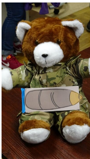
Wielki finał Ogólnopolskiego Turnieju „Misia Wójtka” - dzień pierwszy, 20 maja 2019

Pogoda na razie się utrzymuje, zobaczymy, co przyniesie jutrzejszy dzień, kiedy uczestnicy wybiorą się na zwiedzanie samej bazy wojskowej 1 Brygady Pancernej.