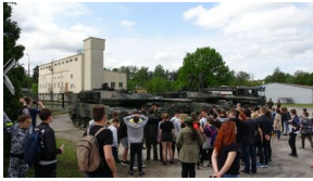
Wielki finał Ogólnopolskiego Turnieju „Misja Wojtka” - dzień drugi, 21 maja 2019