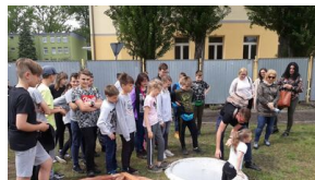
Wielki finał Ogólnopolskiego Turnieju „Misja Wojtka” - dzień drugi, 21 maja 2019