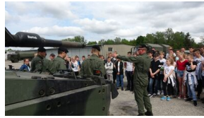
Wielki finał Ogólnopolskiego Turnieju „Misja Wojtka” - dzień drugi, 21 maja 2019