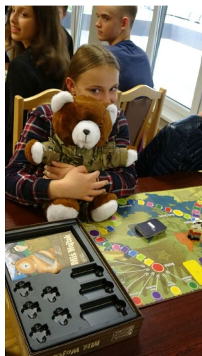
Wielki finał Ogólnopolskiego Turnieju „Misia Wójtka” - dzień pierwszy, 20 maja 2019