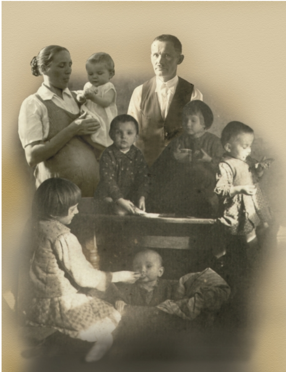
Rodzina Józefa i Wiktorii Ulmów z Markowej