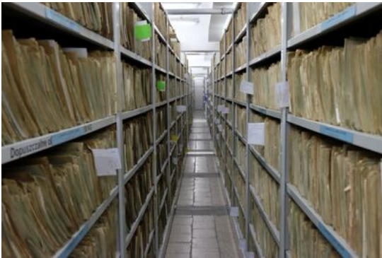
Magazyn archiwalny, ul. Kiobucka.