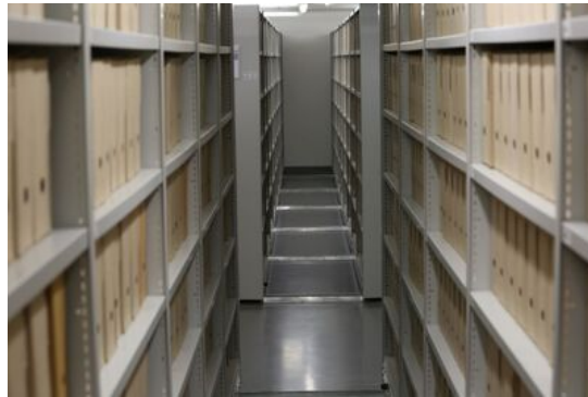
Magazyn archiwalny, ul. Kiobucka.