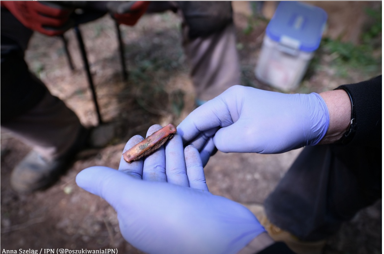
Anna Szelaġ / IPN (@PoszukiwaniaIPN)