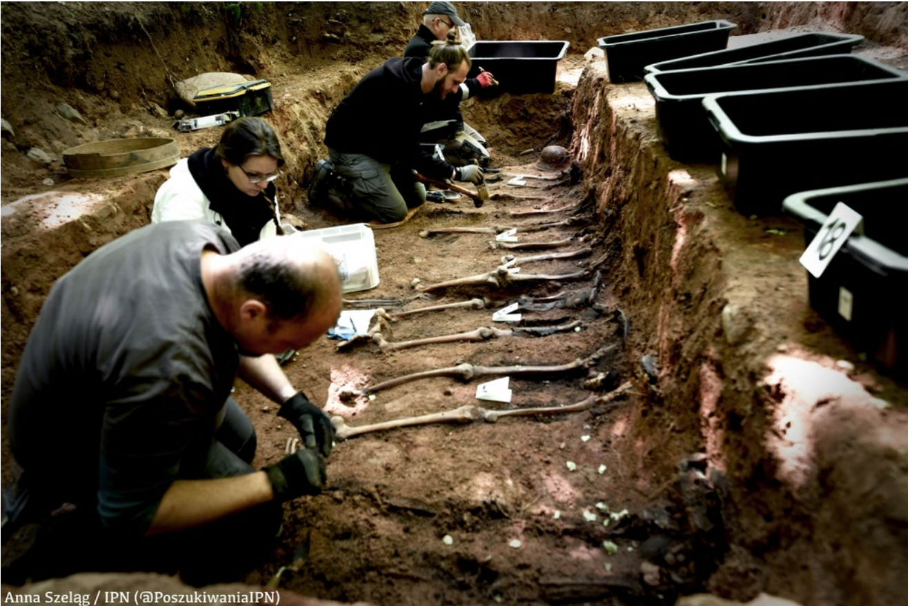
Anna Szelaġ / IPN (@PoszukiwaniaIPN)