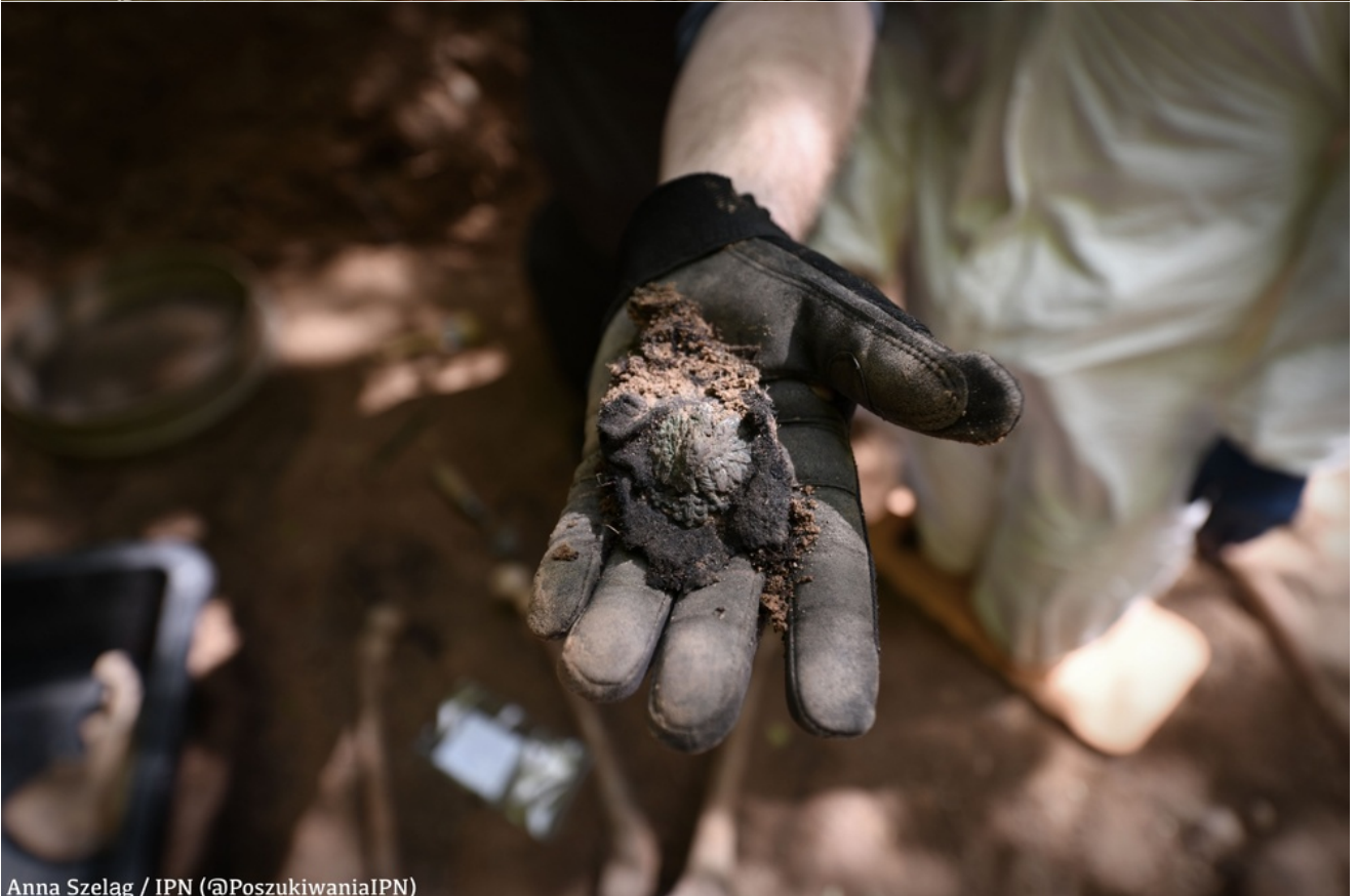
Anna Szelaġ / IPN (@PoszukiwaniaIPN)