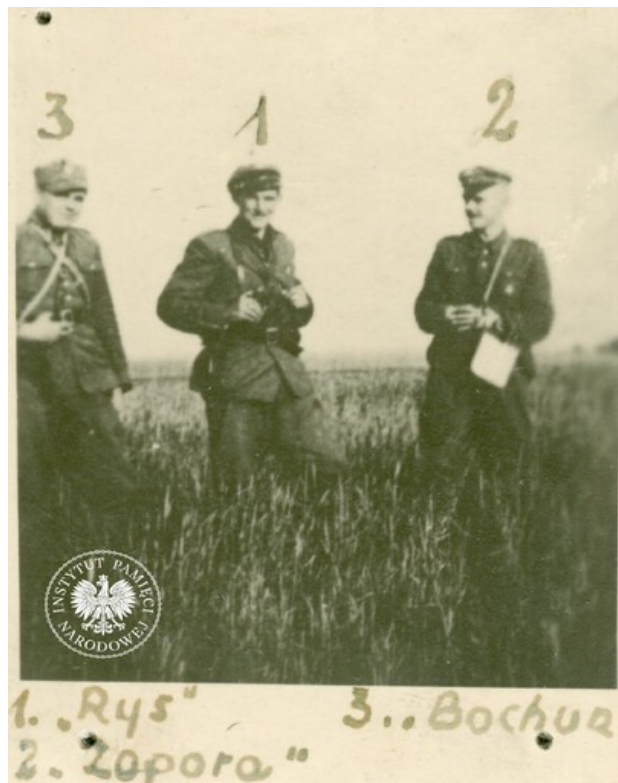
major Hieronim Dekutowski

Hieronim Dekutowski urodził się 24 września 1918 r. w Dzikowie, wsi będącej dziś częścią Tarnobrzega, gdzie w latach 1930 - 1938 uczęszczał do Państwowego Gimnazjum im. Hetmana Jana Tarnowskiego. Bardzo aktywnie działał w ruchu harcerskim. Z początkiem września 1939 wyjechał wraz z siostrą do Lwowa, gdzie prawdopodobnie jako ochotnik przyłączył się do jednostek Wojska Polskiego. 17 września 1939 przekroczył granicę z Węgrami i został internowany. W połowie października przedostał się na Węgry, gdzie został internowany. Po ucieczce z obozu przez Bałkany i Włochy dotarł do Francji, gdzie pełnił służbę w szeregach 2 Dywizji Strzelców Pieszych odtworzonej armii polskiej. Po kapitulacji przedostał się do Wielkiej Brytanii i został przydzielony do 1 Brygady Strzelców. W kwietniu 1942 r. zgłosił się ochotniczo do pełnienia służby w kraju. W nocy z 16 na 17 września 1943 r. został zrzucony na placówkę o krypt. „Garnek 103” w okolicach Wyszkowa w ramach operacji lotniczej „Neon 1”. Został przydzielony do Kedywu Okręgu Lublin AK a następnie objął dowództwo nad kompanią 9 pp Inspektoratu Lublin - Puławy AK. Od stycznia do lipca przeprowadził ponad 90 akcji zbrojnych na terenie Okręgu