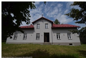
Budynek dawnej gospody "Na Pikietach"