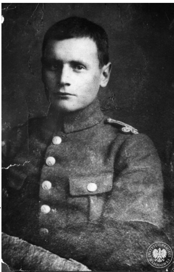
Aleksander Krzyżanowski „Wilk”

Urodził się 18 lutego 1895 r. w Briąnsku w Rosji. Uczęszczał do gimnazjum w Homlu, ale w 1914 r. wraz z rodziną przeniósł się do Petersburga. Na początku 1917 r. został powołany do odbycia służby w rosyjskiej armii. Jesienią wstąpił do I Korpusu Polskiego dowodzonego przez gen. Józefa Dowbór-Muśnickiego, a po jego rozwiązaniu przedostał się do Warszawy. Wziął udział w rozbrajaniu Niemców w Warszawie, w niepodległej Polsce zgłosił się do służby w odrodzonym Wojsku Polskim. Brał udział w wojnie polsko-bolszewickiej jako artylerzysta. W okresie międzywojennym pełnił funkcje dowódcze w oddziałach artylerii. W czasie wojny obronnej w 1939 r. walczył m.in. w bitwie nad Bzurą. Udało mu się uniknąć niewoli, po zakończeniu walk związał się z polskim podziemiem zbrojnym. W 1940 r. trafił do Wilna, gdzie pełnił funkcję szefa sztabu Związku Walki Zbrojnej. W maju 1941 r. objął stanowisko komendanta Okręgu Wileńskiego ZWZ-AK.