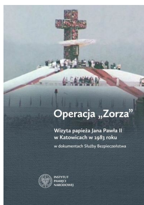
Operacja „Zorza”. Wizyta papieża Jana Pawła II w Katowicach w 1983 roku w dokumentach Służby Bezpieczeństwa