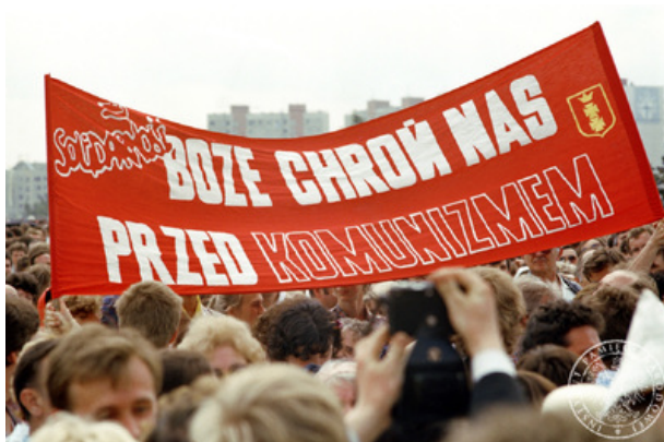
Trzecia pielgrzymka Jana Pawła II do Polski w 1987 r.