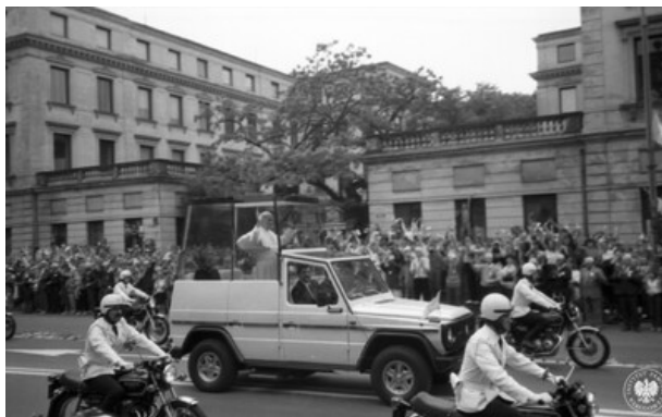
Trzecia pielgrzymka Jana Pawła II do Polski w 1987 r. Przejazd ulicą Krakowskie Przedmieście w Warszawie

Trasa trzeciej pielgrzymki przebiegała przez Warszawę, Lublin, Tarnów, Kraków, Szczecin,