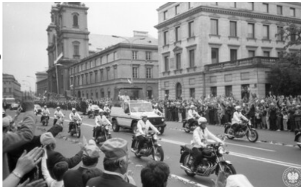
Trzecia pielgrzymka Jana Pawła II do Polski w 1987 r. Przejazd ulicą Krakowskie Przedmieście w Warszawie