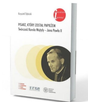
Pisarz, który został papieżem. Twórczość Karola Wojtyły – Jana