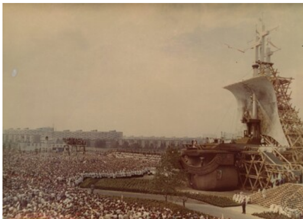
Trzecia pielgrzymka Jana Pawła II do Polski w 1987 r.

W stolicy Ojciec Święty spotkał się z Matką Teresą z Kalkuty i otworzył obrady II Krajowego