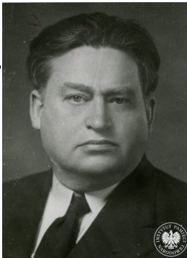
Stanisław Cat Mackiewicz

W 1931 r. odbył podróż po Związku Sowieckim. Jej owocem była publicystyczna książka pt. „Myśl w obcęgach. Studia nad psychologią społeczeństwa Sowieców”, rzetelnie opisująca i krytykująca tamtejsze