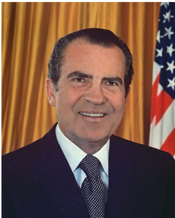
Richard Nixon

Wizyta prezydenta Nixona w PRL była częścią podróży dyplomatycznej, obejmującej Związek Sowiecki i Iran. 26 maja 1972 r. prezydent Stanów Zjednoczonych spotkał się z sekretarzem generalnym KPZS Leonidem Breżniewem i podpisał układ o ograniczeniu systemów obrony przeciwrakietowej (Anti-Ballistic Missile Treaty) oraz tymczasowe porozumienie w zakresie ograniczania strategicznych zbrojeń ofensywnych. Później udał się do Teheranu. W drodze powrotnej, 31 maja 1972 r., samolot prezydenta Richarda Nixona wylądował