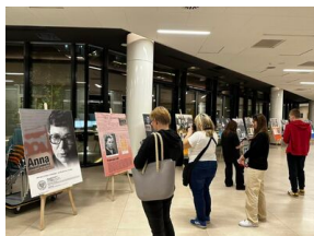
Noc Muzeów w Szczecinie