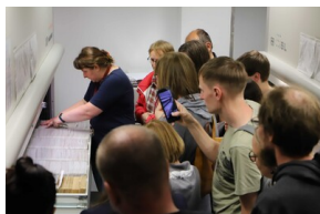
Noc Muzeów w Gdańsku