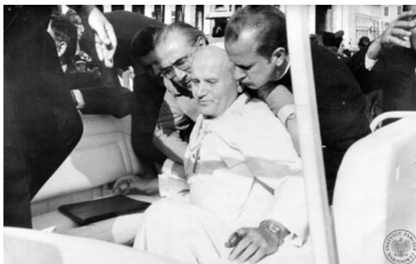
Chwila po zamachu. Ranny papież Jan Paweł II, podtrzymywany przez ks. Stanisława Dziwisza.

13 maja 1981 r., kilkanaście minut po godz. 17., papież Jan Paweł II, podczas przemieszczania się w otwartym samochodzie, wśród tłumów wiernych, czekających na audiencję generalną na placu św. Piotra w Rzymie, został, w czasie próby zamachu na jego życie, zraniony w rękę i brzuch przez 23-letniego Turka, Mehmeda Ali Agcę.