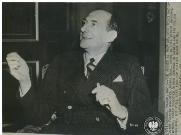
Minister spraw zagranicznych Rzeczypospolitej Polskiej Józef Beck w dniu 9 maja 1939 r.

26 stycznia 1934 r. doprowadził do podpisania