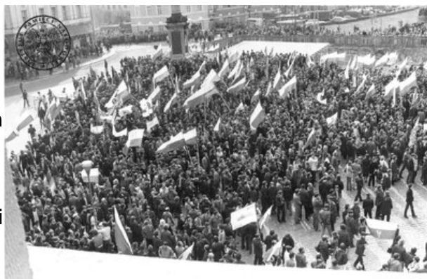
Demonstracja NSZZ Solidarność w dniu 3 maja 1982 r. na Placu Zamkowym

Święto Konstytucji 3 Maja było w PRL świętem zakazanym. Decydowały o tym dwa czynniki. Przede wszystkim tradycja państwowych obchodów rocznicy uchwalenia Konstytucji 3 Maja była związana z myślą niepodległościową narodu i suwerenności państwa, co w warunkach uzależnienia Polski od Związku Sowieckiego stanowiło problem dla komunistycznych władz w Polsce. Drugą kwestią było podniesienie w PRL do rangi święta państwowego obchodów „Dnia Międzynarodowej Solidarności Klasy Robotniczej” powszechnie nazywanym „Świętem Pracy” lub „1 Maja”. Spontaniczne i wpływające z narodowego DNA upamiętnianie rocznicy uchwalenia Konstytucji 3 Maja, było konkurencją dla 1-majowego partyjnie reżyserowanego święta, które w nowych realiach uzyskać miało status jednego z najważniejszych świąt państwowych.