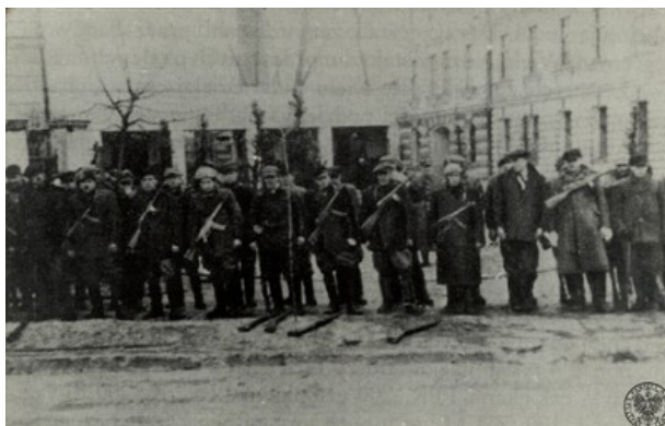
Składanie broni w wyniku amnestii ogłoszonej dla członków podziemia antykomunistycznego

Dekretem z 2 sierpnia 1945 r. Prezydium Krajowej Rady Narodowej zatwierdził amnestię dla osób, które popełniły przestępstwa przed dniem 22 lipca 1945 r. Amnestia miała polegać na ujawnieniu się żołnierzy podziemia niepodległościowego pozostających w konspiracji. Amnestia okazała się porażką komunistów. Część ułaskawionych w obawie przed represjami i ponownym aresztowaniem powróciła do konspiracji.