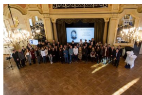
Konkurs poświęcony Irenie Sendlerowej

29 listopada 2018 r. w Łodzi odbył się finał ogólnopolskiego konkursu historycznego dla uczniów szkół ponadgimnazjalnych „»Nie jestem żadną bohaterką«. Irena Sendlerowa na tle historii II wojny światowej na ziemiach polskich (1939–1945)”. Konkurs został zorganizowany przez Oddział Instytutu Pamięci Narodowej w Łodzi w związku z uchwałą Sejmu RP z 8 czerwca 2017 r. ustanawiającą rok 2018 Rokiem Ireny Sendlerowej.