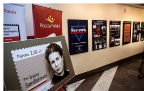
Znaczek z Ireną Sendlerową

W 2018 r. Instytut Pamięci Narodowej i Poczta Polska przygotowali znaczek okolicznościowy z Ireną Sendlerową.