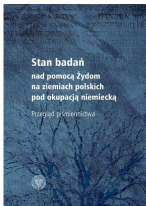
Stan badań nad pomocą Żydom

nad pomocą Żydom na ziemiach polskich pod okupacją niemiecką – przegląd piśmiennictwa” pod red. Tomasza Domańskiego i Alicji Gontarek. Publikacja jest darmowa i można ją pobrać z poniższej strony.