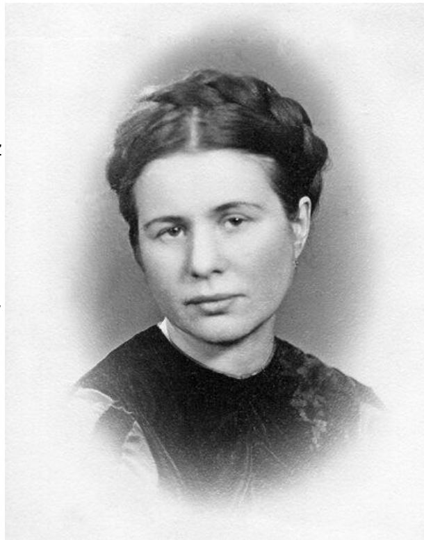
Irena Sendlerowa

Po zdaniu matury w 1929 r. wyjechała do stolicy i rozpoczęła studia na wydziale prawa Uniwersytetu Warszawskiego, potem przeniosiła się na polonistykę. Miała praktyki w założonym przez Janusza Korczaka Domu Sierot „Różyczka” w Wawrze. Następnie podjęła pracę w