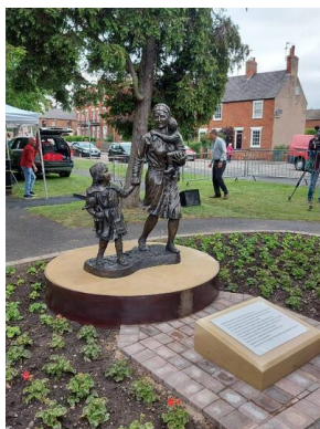
Pomnik Ireny Sendlerowej w Wielkiej Brytanii