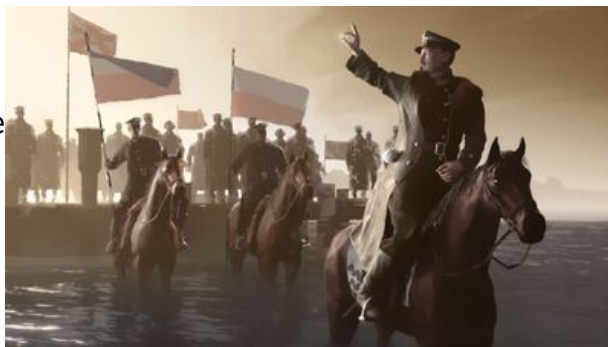
Zaślubiny Polski z morzem. Kadr z filmu Niezwyciężeni

Ceremonię zaślubin poprzedzał pochód polskich wojsk przez Pomorze. Po ponad 120 latach niewoli do macierzy powracały kolejne miasta. Pochód wojsk polskich stanowił realizację decyzji podjętych na konferencji paryskiej i zawartych w traktacie wersalskim. Ratyfikowany 10 stycznia 1920 r. traktat ostatecznie potwierdzał zachodnie i północne granice odrodzonej Polski. Zgodnie z jego zapisami, Polska miała otrzymać dostęp do Morza Bałtyckiego.