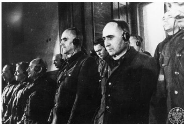
Załoga KL Auschwitz-Birkenau przed Najwyższym Trybunałem Narodowym podczas ogłaszania wyroku. W pierwszym rzędzie od lewej: Arthur Liebehenschel, Maria Mandl vel Mandel, Hans Aumeier, Karl Ernst Möckel, Max Grabner, Franz Xaver Kraus. Z tyłu m.in. Erich Muhsfeldt.

Oskarżeni nie przyznawali się do winy. Prokuratorzy mieli jednak do dyspozycji obszerny materiał dowodowy, przygotowany przez Okręgową Komisję Badania Zbrodni Niemieckich w Krakowie, na której czele stał sędzia śledczy Jan Sehn.