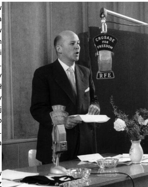
Jan Nowak Jeziorański

Po ucieczce z niewoli od 1940 r. działał w podziemiu, a od 1941 r. w ZWZ (przemianowanym w 1942 r. na Armię Krajową). Brał udział w Akcji „N” - zakonspirowanej komórce rozprowadzającej materiały propagandowe, których celem było obniżenie morale żołnierzy niemieckich.