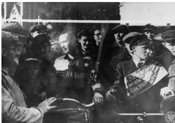
Dwóch młodych mężczyzn z rowerami stoi w tłumie ludzi. Mężczyzna z lewej ma szarfę z napisem po rosyjsku, mężczyzna z prawej ma przewieszoną przez ramię szarfę z polskim napisem: "NIECH ŻYJE NIEROZERWALNY BRATERSKI (ZWIĄZEK) NARODÓW ZWIĄZKU SOWIECKIEGO I BIAŁORUSI ZACHODNIEJ".

Związek Sowiecki, mając już wcześniej przerobiony schemat działania, był znakomicie przygotowany do procesu budowy władz administracyjnych na okupowanych terenach. Na dzień przed atakiem na Polskę wydano Dyrektywę nr 01 Rady Wojennej Frontu Białoruskiego z 16 września 1939 r., która określała zasady powoływania władz tymczasowych na terenach II RP zajmowanych przez Armię Czerwoną. Ponadto zobowiązywała sowieckich funkcjonariuszy do powołania gwardii robotniczych oraz komitetów