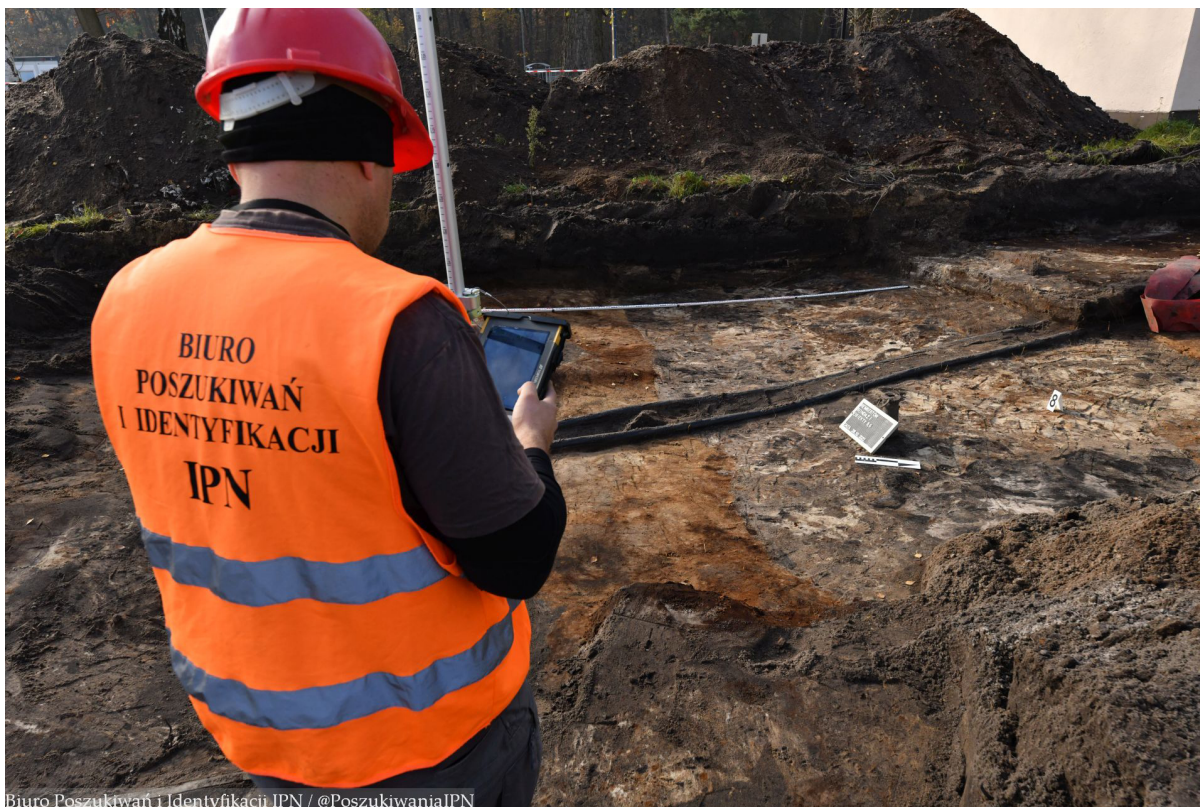
Biuro Poszukiwań i Identyfikacji IPN / @PoszukiwaniaIPN

Rembertów: Prace poszukiwawcze na terenie dawnego obozu NKWD