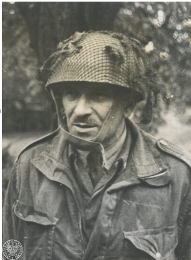
gen. Stanisław Sosabowski

Na angielskiej ziemi objął dowodzenie 4. Brygadą Kadrową Strzelców, która od stycznia 1941 r. miała spełniać rolę ośrodka przygotowawczego i szkolnego dla kandydatów do polskich wojsk spadochronowych. Decyzją gen. Sikorskiego 23 września 1941 r. brygada została przemianowana na 1. Brygadę Spadochronową, jednostkę podlegającą bezpośrednio Naczelnemu Wodzowi. Dowódcą brygady został Stanisław Sosabowski.