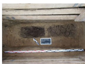
Prace poszukiwawcze na cmentarzu