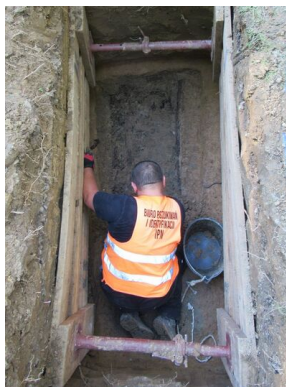
Prace poszukiwawcze na cmentarzu Rakowickim.