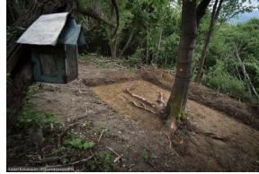
Cisiec: Poszukiwania szczątków Józefa Maślanki