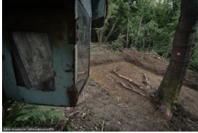
Cisiec: Poszukiwania szczątków Józefa Maślanki