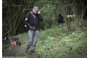
Cisiec: Poszukiwania szczątków Józefa Maślanki