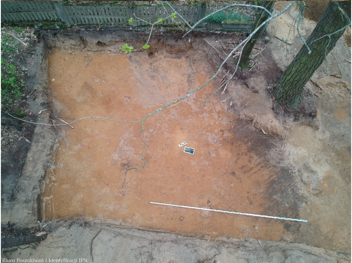
Biuro Poszukiwań i Identyfikacji IPN