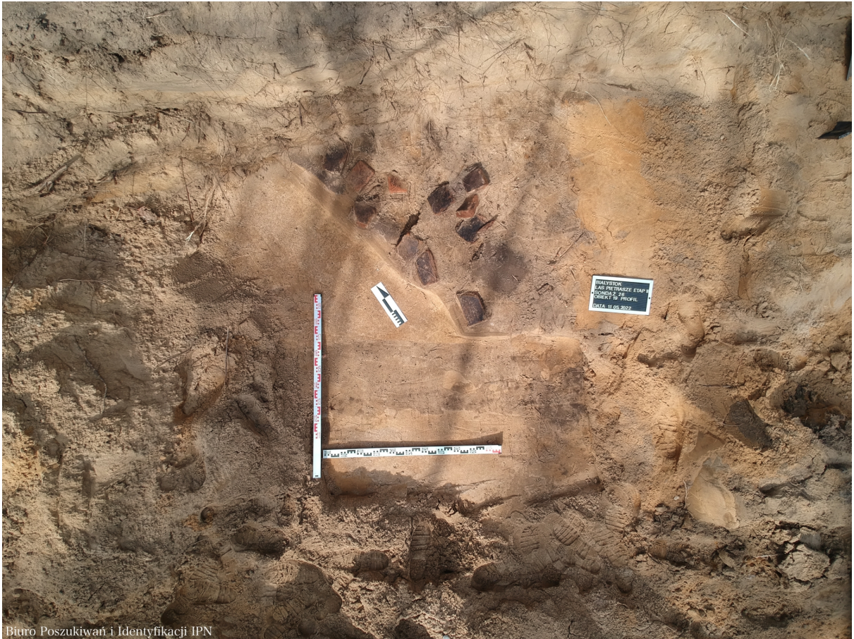
Biuro Poszukiwań i Identyfikacji IPN