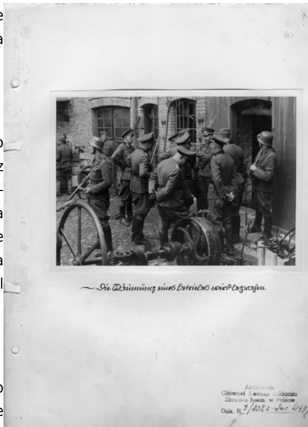
GK-22-1-1-40-2-1 karta z Raportu Stroopa

16 maja Niemcy ogłosili zakończenie walk w getcie; tego dnia wysadzili w powietrze synagogę przy ul. Tłomackie. Teren getta został zrównany z ziemią. Jürgen Stroop w swoim raporcie zanotował z nieskrywaną dumą: „Żydowska dzielnica mieszkaniowa już nie istnieje!”.