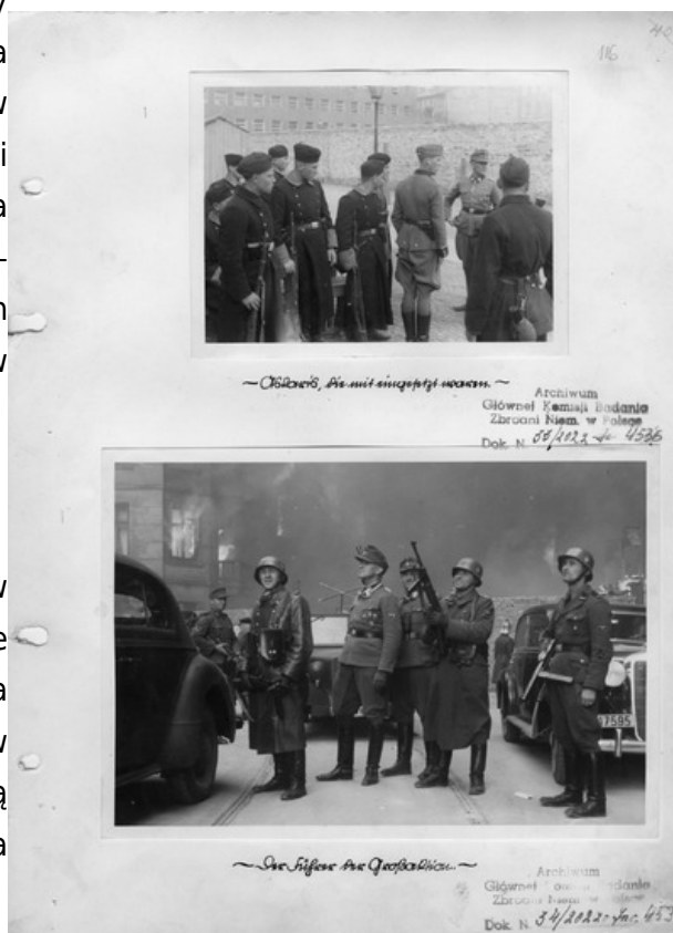
GK-22-1-1-40-2-1 karta z Raportu Stroopa (1)