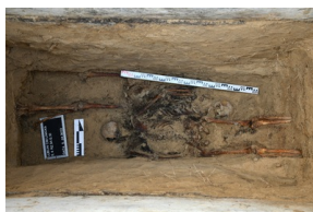
Lublin: Poszukiwania na cmentarzu przy ul.