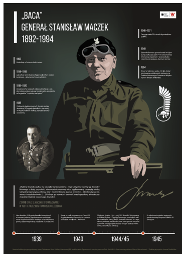
Gen. Stanisław Maczek - infografika