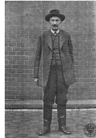
Wincenty Witos. Sygnatura: a: IPNB-U-1- 4-5-1

Na ławie oskarżonych zasiedli przywódcy antysanacyjnej opozycji z tzw. Centrolewu - z PPS, PSL „Piast”, PSL „Wyzwolenie” i Stronnictwa Chłopskiego; wśród nich znalazł się trzykrotny premier, działacz ruchu ludowego, jeden z Ojców Niepodległości Wincenty Witos.