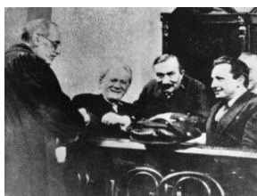
Ława oskarżonych w