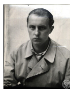
Jan Rodowicz