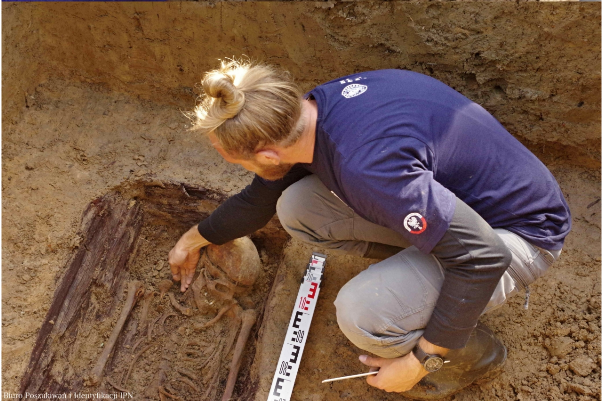
Biuro Poszukiwań i Identyfikacji IPN