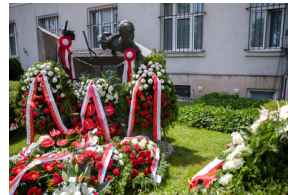
Uroczyste odsłonięcie pomnika Jana Rodowicza „Anody” na dziedzińcu Ministerstwa Sprawiedliwości w Warszawie - 24 czerwca 2021.