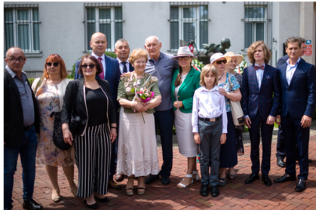
Uroczyste odsłonięcie pomnika Jana Rodowicza „Anody” na dziedzińcu Ministerstwa Sprawiedliwości w Warszawie – 24 czerwca 2021.