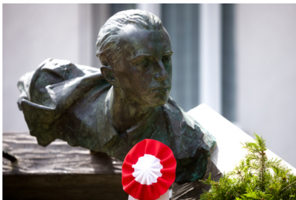
Uroczyste odsłonięcie pomnika Jana Rodowicza „Anody” na dziedzińcu Ministerstwa Sprawiedliwości w Warszawie - 24 czerwca 2021.