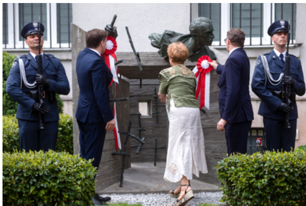
Uroczyste odsłonięcie pomnika Jana Rodowicza „Anody” na dziedzińcu Ministerstwa Sprawiedliwości w Warszawie - 24 czerwca 2021.

Inicjatywę rodziny Jana Rodowicza „Anody” przyjęło Ministerstwo Sprawiedliwości, zapraszając do współpracy Instytut Pamięci Narodowej, który sfinansował wykonanie pomnika.