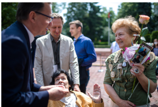
Uroczyste odsłonięcie pomnika Jana Rodowicza „Anody” na dziedzińcu Ministerstwa Sprawiedliwości w Warszawie - 24 czerwca 2021.