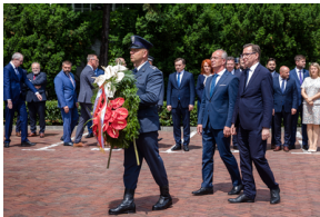
Uroczyste odsłonięcie pomnika Jana Rodowicza „Anody” na dziedzińcu Ministerstwa Sprawiedliwości w Warszawie - 24 czerwca 2021.