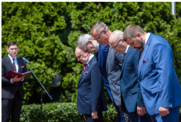
Uroczyste odsłonięcie pomnika Jana Rodowicza „Anody” na dziedzińcu Ministerstwa Sprawiedliwości w Warszawie - 24 czerwca 2021.