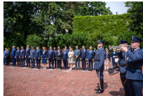
Uroczyste odsłonięcie pomnika Jana Rodowicza „Anody” na dziedzińcu Ministerstwa Sprawiedliwości w Warszawie - 24 czerwca 2021.