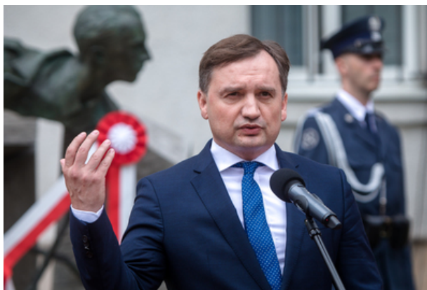
Minister sprawiedliwości Zbigniew Ziobro podczas odsłonięcia pomnika Jana Rodowicza „Anody” na dziedzińcu Ministerstwa Sprawiedliwości w Warszawie - 24 czerwca 2021.