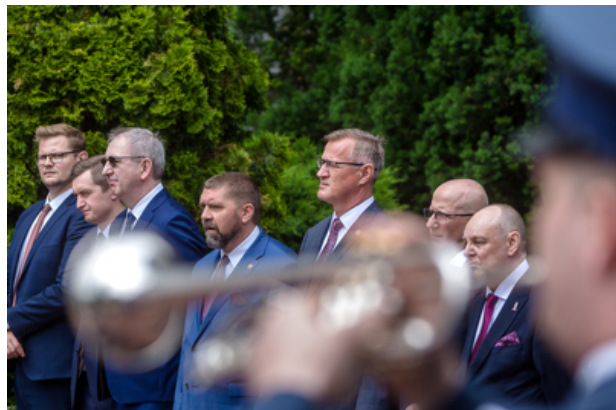
Uroczyste odsłonięcie pomnika Jana Rodowicza „Anody” na dziedzińcu Ministerstwa Sprawiedliwości w Warszawie – 24 czerwca 2021.