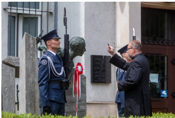
Uroczyste odsłonięcie pomnika Jana Rodowicza „Anody” na dziedzińcu Ministerstwa Sprawiedliwości w Warszawie - 24 czerwca 2021.