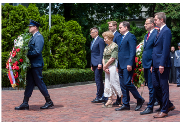
Uroczyste odsłonięcie pomnika Jana Rodowicza „Anody” na dziedzińcu Ministerstwa Sprawiedliwości w Warszawie - 24 czerwca 2021.