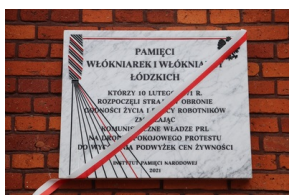
Prezes IPN odsłonił