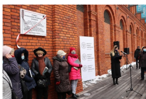
Prezes IPN odsłonił