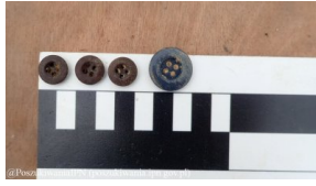
Lublin - cm. przy ul.