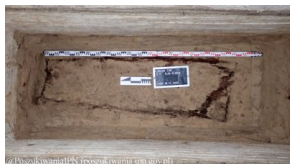
Lublin - cm. przy ul. Unickiej