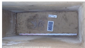
Lublin - cm. przy ul. Unickiej