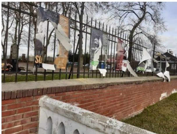
Zniszczona wystawa „Wyszyńskiego i Wojtyły gramatyka życia”.

Bezmyślne zniszczenie ekspozycji o postaciach mających ogromne i niepodważalne zasługi dla naszego kraju i świata wywołuje uzasadnione oburzenie. Zarówno św. Jan Paweł II, jak i kard. Stefan Wyszyński to osoby, które umacniały Polaków w niezwykle trudnych czasach. Nie ulega wątpliwości, że były to postacie, które nie tylko kształtowały duchowy rozwój narodu polskiego, ale również swoimi postawami odegrały kluczową rolę w walce z bezbożnym komunizmem. IPN w ramach