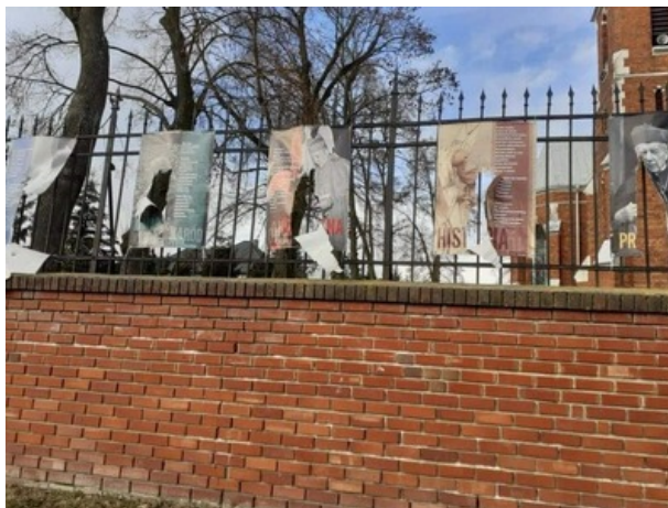
Zniszczona wystawa „Wyszyńskiego i Wojtyły gramatyka życia”.

Żadne akty wandalizmu nie powstrzymają popularyzowania wiedzy o tych dwóch wielkich postaciach. Dlatego wystawa w najbliższych dniach ponownie pojawi się przy kościele św. Jozafata Kuncewicza w Rejowcu, jak również będzie prezentowana w innych miejscowościach Lubelszczyzny.