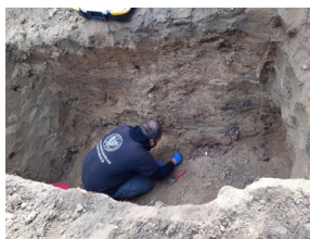
Szczecin: Poszukiwania na Cmentarzu Centralnym