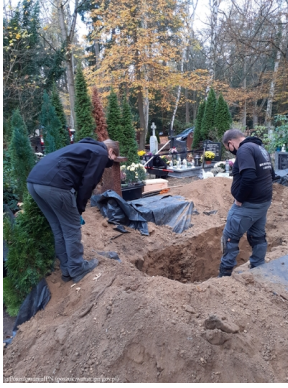
Szczecin: Poszukiwania na Cmentarzu Centralnym