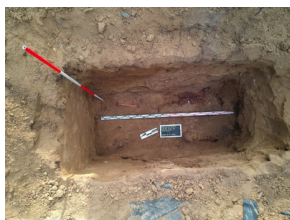
Szczecin: Poszukiwania na Cmentarzu Centralnym