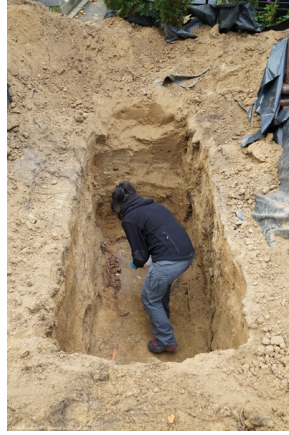
Szczecin: Poszukiwania na Cmentarzu Centralnym