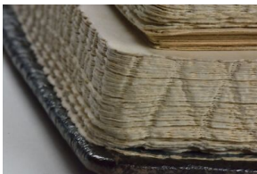
Zdjęcia raportu Jürgena Stroopa „Es gibt keinen jüdischen Wohnbezirk in Warschau mehr!“ (Żydowska dzielnica mieszkaniowa w Warszawie już nie istnieje!)