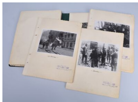
Zdjęcia raportu Jürgena Stroopa „Es gibt keinen jüdischen Wohnbezirk in Warschau mehr!“ (Żydowska dzielnica mieszkaniowa w Warszawie już nie istnieje!)