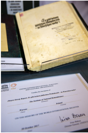
Raport Jürgena Stroopa.