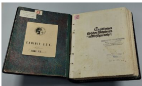
Zdjęcia raportu Jürgena Stroopa „Es gibt keinen jüdischen Wohnbezirk in Warschau mehr!“ (Żydowska dzielnica mieszkaniowa w Warszawie już nie istnieje!)

W 2009 r. Instytut Pamięci Narodowej przy współpracy Żydowskiego Instytutu Historycznego wydał drukiem raport Stroopa. Ukazał się on ze wstępem ówczesnego prezesa IPN Janusza Kurtyki. Można się z tą publikacją zapoznać także na portalu IPN przystanekhistoria.pl