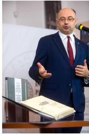
Mateusz Szpytma – wiceprezes Instytutu Pamięci Narodowej.