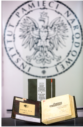
Raport Jürgena Stroopa.

W 2009 r. Instytut Pamięci Narodowej przy współpracy Żydowskiego Instytutu Historycznego wydał drukiem raport Stroopa. Ukazał się on ze wstępem ówczesnego prezesa IPN Janusza Kurtyki. Można się z tą publikacją zapoznać także na portalu IPN przystanekhistoria.pl