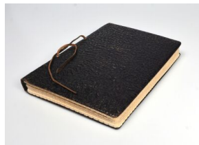
Zdjęcia raportu Jürgena Stroopa „Es gibt keinen jüdischen Wohnbezirk in Warschau mehr!“ (Żydowska dzielnica mieszkaniowa w Warszawie już nie istnieje!)