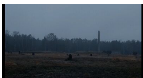
Kadry z filmu „Polmission. Tajemnice paszportów”