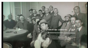
Kadry z filmu „Polmission. Tajemnice paszportów”