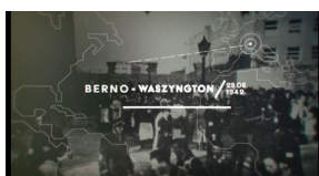
Kadry z filmu „Polmission. Tajemnice paszportów”