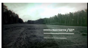
Kadry z filmu „Polmission. Tajemnice paszportów”