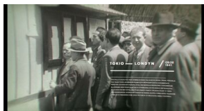
Kadry z filmu „Polmission. Tajemnice paszportów”