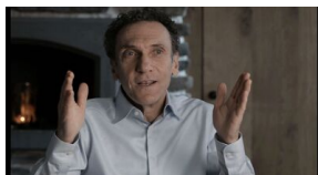
Kadry z filmu „Polmission. Tajemnice paszportów”