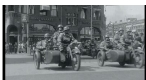
Kadry z filmu „Polmission. Tajemnice paszportów”