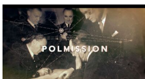
Kadry z filmu „Polmission. Tajemnice paszportów”