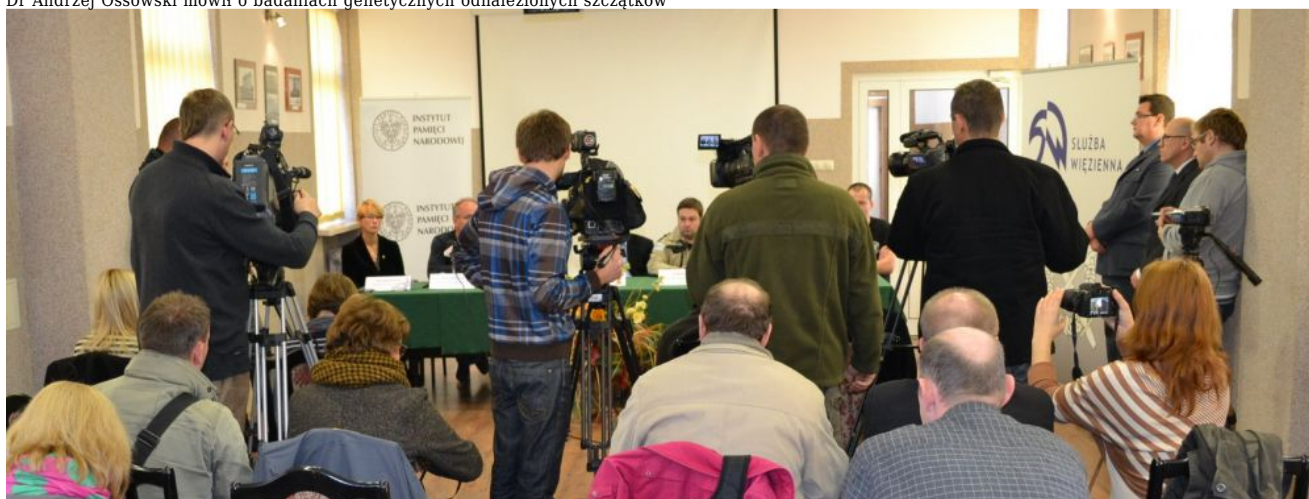
Konferencja cieszyła się dużym zainteresowaniem mediów