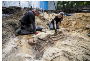
Prace Biura Poszukiwań i Identyfikacji IPN na terenie dawnego więzienia „Toledo” przy ul. Namysłowskiej w Warszawie - 7 września 2020.