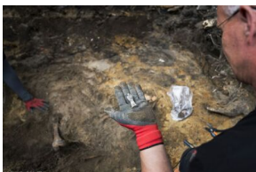
Prace Biura Poszukiwań i Identyfikacji IPN na terenie dawnego więzienia „Toledo” przy ul. Namysłowskiej w Warszawie - 7 września 2020.