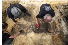
Prace Biura Poszukiwań i Identyfikacji IPN na terenie dawnego więzienia „Toledo” przy ul. Namysłowskiej w Warszawie - 7 września 2020.