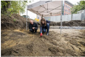
Prace Biura Poszukiwań i Identyfikacji IPN na terenie dawnego więzienia „Toledo” przy ul. Namysłowskiej w Warszawie - 7 września 2020.

należący niegdyś do dawnego Aresztu Karno-Śledczego Warszawa III (tzw. Toledo). Bezpośrednio po wojnie było tutaj więzienie NKWD/UB, w którym byli więzieni m.in. członkowie podziemia antykomunistycznego. Według relacji świadków w murach więzienia wykonano wiele wyroków śmierci. Podobnie jak w przypadku innych miejsc, w dokumentacji więziennej brak jest informacji o miejscu, gdzie grzebano ciała zamordowanych żołnierzy.