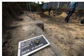
Prace Biura Poszukiwań i Identyfikacji IPN na terenie dawnego więzienia „Toledo” przy ul. Namysłowskiej w Warszawie - 7 września 2020.