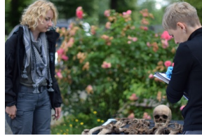
W Gliwicach odnaleziono szczątki skazanego za pomoc partyzantom.