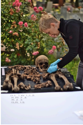
W Gliwicach odnaleziono szczątki skazanego za pomoc partyzantom.