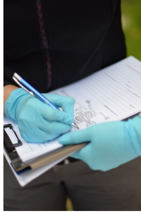
W Gliwicach odnaleziono szczątki skazanego za pomoc partyzantom.